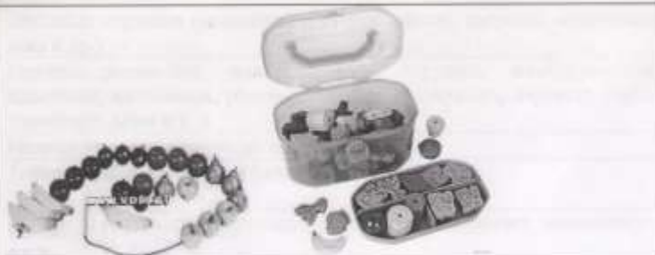
Шнуровки. Игрушки с крепящимися деталями.